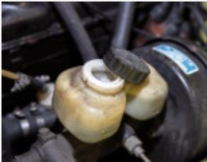
Nicht alle Oldtimer wurden stets korrekt gewartet. So blieben die Flüssigkeiten zu lange drin...