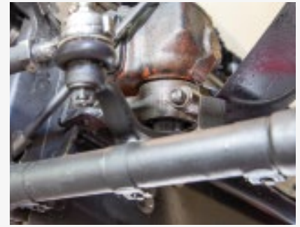
So fährt sich das Auto wieder gerade: Neue Gelenke wirken manchmal wunder.