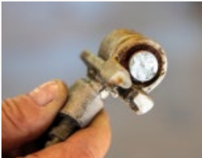
Typischer Mangel: Radbremszylinder werden oft undicht und sorgen für Folgeschäden.