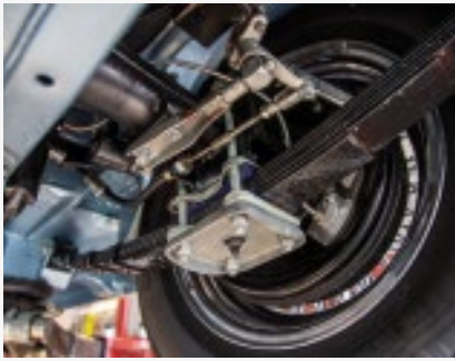
So macht's Spass: Blattfedern freuen sich sehr über eine gelegentliche Fettpackung.