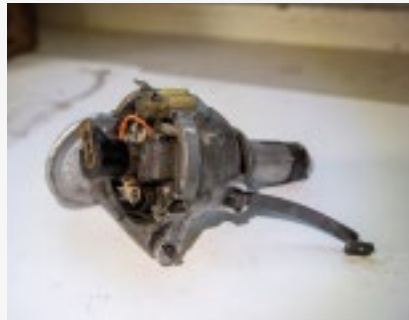
Folgeschäden drohen auch bei Zündverteilern, wenn Fliehkichte und Wellen nie geölt werden.