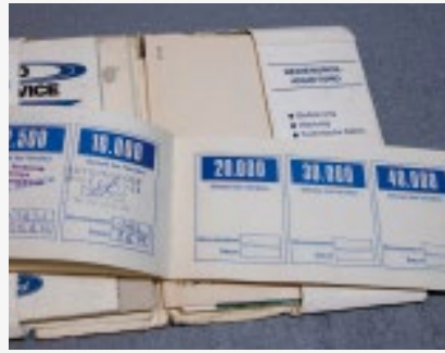
...der Wartungshistorie, aber oft ist die Dokumentation lückenhaft. In so einem Fall...