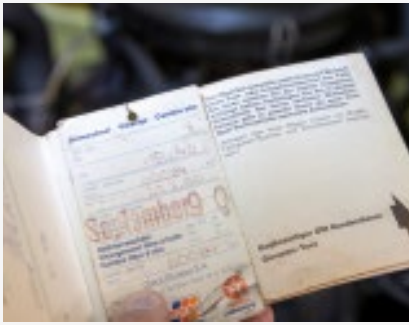
Geschichtsforschung: Das Vorhandensein von Dokumenten erleichtert die Aufarbeitung...