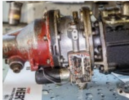
...oder wurden falsch eingesetzt. So kann z.B. falsches Öl den Overdrive zerstören.