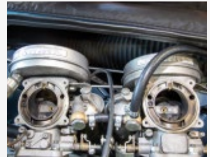
Der Schein trög: Diese Vergaser sahen aussen gut aus, wurden aber innen schon lange nicht mehr gereinigt.

seinen Bauteilen sollte möglichst gut bekannt sein», hält Stefan Mäder fest und ergänzt: «Eine Analyse bietet sich sowohl nach dem Kauf eines Fahrzeugs an als auch nach längerem Besitz. Zum einen heisst frisch ab MFK nicht, dass alles perfekt gewartet ist, zum anderen erlebe ich oft, dass Fahrzeugbesitzer sich an Mängel wie etwa schwammige Fahrwerke gewöhnen und denken, das sei normal.»