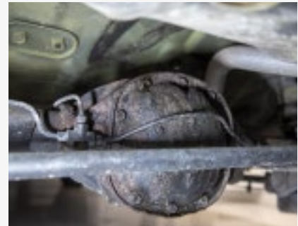
Ob diese Achse schon je mal neues Öl erhalten hat? Nach fünfzig Jahren wär's nicht verkehrt.

der Radbremszylinder dauert nicht lange. Wenn aber ein Radbremszylinder mehrere Jahre lang unbemerkt Bremsflüssigkeit verliert, sind neben dem Zylinder meist auch die Bremsbacken und die Bremsmechanik fällig. Wer also den Aufwand zunächst scheut, hat später höhere Kosten.»