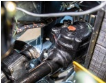
Gut gefüllt: Auch Lenkgetriebe benötigen nach Jahrzehnten mal Schmierstoff...