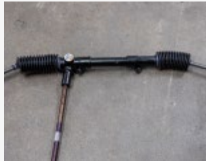
... und das gilt auch für Zahnstangenlenkungen. Die richtige Schmierung verlängert das Leben.