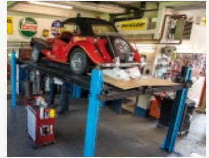
...bleibt als einzige Alternative ein ausführlicher Check aller Bestandteile des Fahrzeugs.