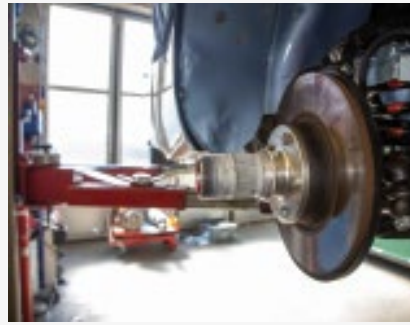
So lässt es sich leben: Ein korrekt eingefetteter Konus verschleisst bedeutend weniger schnell.