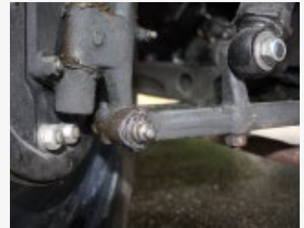
Füttern erlaubt: Die Schmiernippel am Fahrzeug sollten nicht vernachlässigt werden.